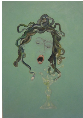
“L'Ira di Dio” - cm.70x50 - tecnica mista su tela, olio e matita – anno 2012 A sostegno del Progetto “L'Arte per la Ricerca” - Associazione CCSVI nella Sclerosi Multipla Onlus

extra ordinem : dedicato alla problematica della CCSVI (Insufficienza Venosa Cronica Cerebro Spinale)