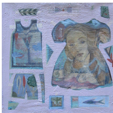
“Il Vestito di Venere” - cm.40x40 – tecnica mista su tela – anno 2011 A sostegno del Progetto “L'Arte per la Ricerca” - Associazione CCSVI nella Sclerosi Multipla Onlus