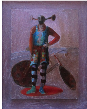
“Il Ciclista” - cm.50x40 (con cornice 60x50) - tecnica mista, olio su tavola – anno 2013 A sostegno della Campagna “Arte Solidale” - CCSVI nella Sclerosi Multipla Emilia Romagna Onlus