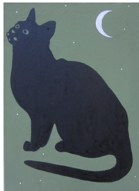
“Il Gatto e la Luna” - cm.34x23 – acrilico su tela – anno 2012 A sostegno del Progetto “L'Arte per la Ricerca” - Associazione CCSVI nella Sclerosi Multipla Onlus