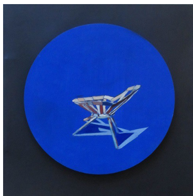
"F.Kakfa <<Il silenzio delle sirene>>" - cm.50x50 – tecnica mista olio e acrilico su tavola e tela - anno 2011 A sostegno del Progetto “L'Arte per la Ricerca” - Associazione CCSVI nella Sclerosi Multipla Onlus