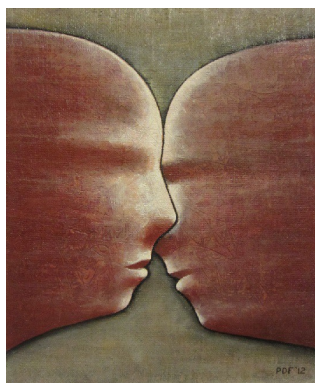
“Senza Titolo” - cm.50x41 - tecnica mista su tavola – anno 2012 A sostegno del Progetto “L'Arte per la Ricerca” - Associazione CCSVI nella Sclerosi Multipla Onlus