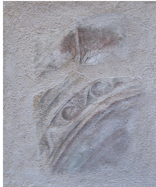
“Frammenti di paesaggio ritrovato” - cm 60x50 – tecnica mista - anno 1992 A sostegno del Progetto “L'Arte per la Ricerca” - Associazione CCSVI nella Sclerosi Multipla Onlus