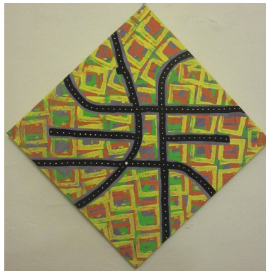
“Aquilone” - cm 50x50 – ducotone su tela - anno 2014 A sostegno della Campagna “Arte Solidale” - CCSVI nella Sclerosi Multipla Emilia Romagna Onlus