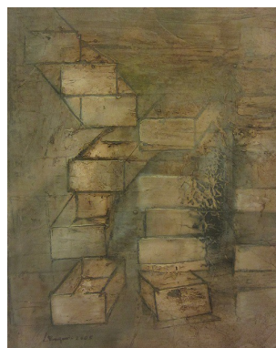
“Per giungere a te” - cm. 50x40 - olio su tela – anno 2005 A sostegno del Progetto “L'Arte per la Ricerca” - Associazione CCSVI nella Sclerosi Multipla Onlus