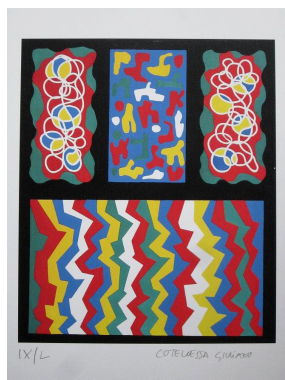
“Angeli dell'universo per un universo senza bombe” - cm.45x32 - litografia – anno 1990 A sostegno del Progetto “L'Arte per la Ricerca” - Associazione CCSVI nella Sclerosi Multipla Onlus