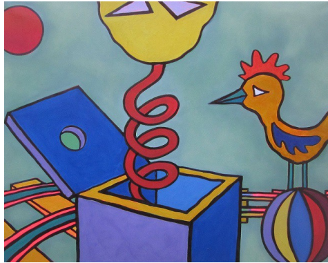
“La Scatola” - cm.80x100 – Olio su tela – anno 2014 A sostegno della Campagna “Arte Solidale” - CCSVI nella Sclerosi Multipla Emilia Romagna Onlus